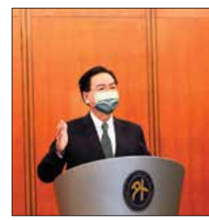
Taiwan's Foreign Minister Joseph Wu speaks during a press conference in Taipei, Taiwan on Tuesday

China says its drills were prompted by the visit to the island last week by US House Speaker Nancy Pelosi, but Wu said China was using her trip