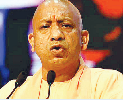
5 खिलाड़ियों को मिलेगी नागीदारी राशि

उत्तर प्रदेश की योगी सरकार खेल और खिलाड़ियों के लिए समर्पण भाव से काम कर रही है। सरकार की योजनाओं और सुविधाओं का नतीजा भी देखने को मिल रहा है। हाल ही में संपन्न हुए बर्मिंघम कॉमनवेल्थ गेम्स में उत्तर प्रदेश के 8 खिलाड़ियों ने देश के लिए मेडलस जीतकर न सिर्फ देश का बल्कि प्रदेश का भी गौरव बढ़ाया है। इन सभी पदकवीरों को उत्तर प्रदेश सरकार पूर्व निर्धारित नकद इनाम व अन्य सुविधाओं से सम्मानित करेगी। गौरतलब है कि प्रदेश सरकार ने नई खेल नीति के तहत हाल ही में घोषणा की थी कि अंतर्राष्ट्रीय स्तर पर मेडलस जीतने वाले खिलाड़ियों को उचित सम्मान और पद से नवाजा जाएगा। इसके तहत, स्वर्ण पदक जीतने वाले खिलाड़ी को एक करोड़ रुपए, रजत पदक विजेता को 75 लाख रुपए और कांस्य पदक जीतने वाले को 50 लाख रुपए का नकद इनाम दिया जाएगा। साथ ही, सभी पदकवीरों को राजपत्रित अधिकारी का पद भी दिया जाएगा।